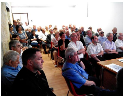
Presentación nuevas instalaciones