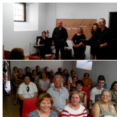
Actuación del grupo Alejandro