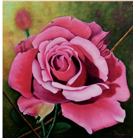
Júbilo. Óleo sobre lienzo. 70 x 70 x 4 cm.