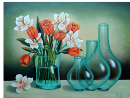
Luminosidad. Óleo/Lienzo. 50 x 65 x 4 cm.