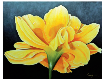
Melancolía. Óleo/Lienzo. 50 x 65 x 4 cm.